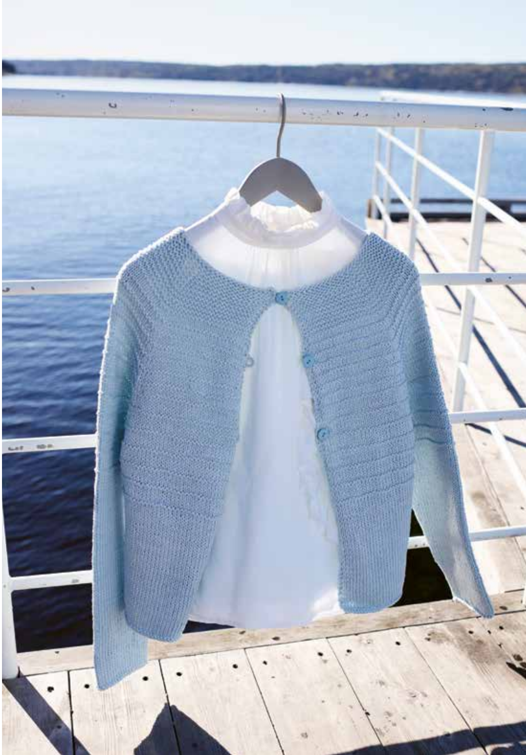
285-10 Jakke med raglanfelling i Sumatra