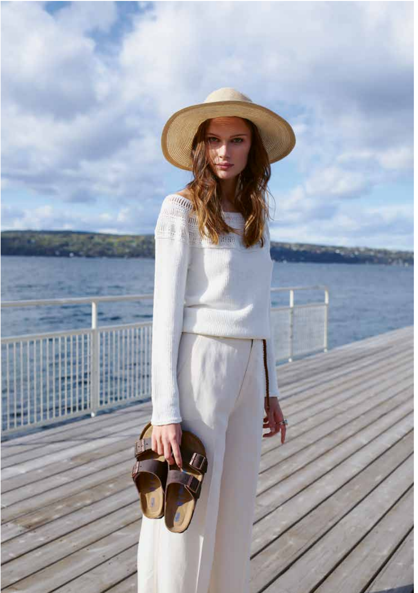
285-12 Genser med heklet bærestykke i Petunia