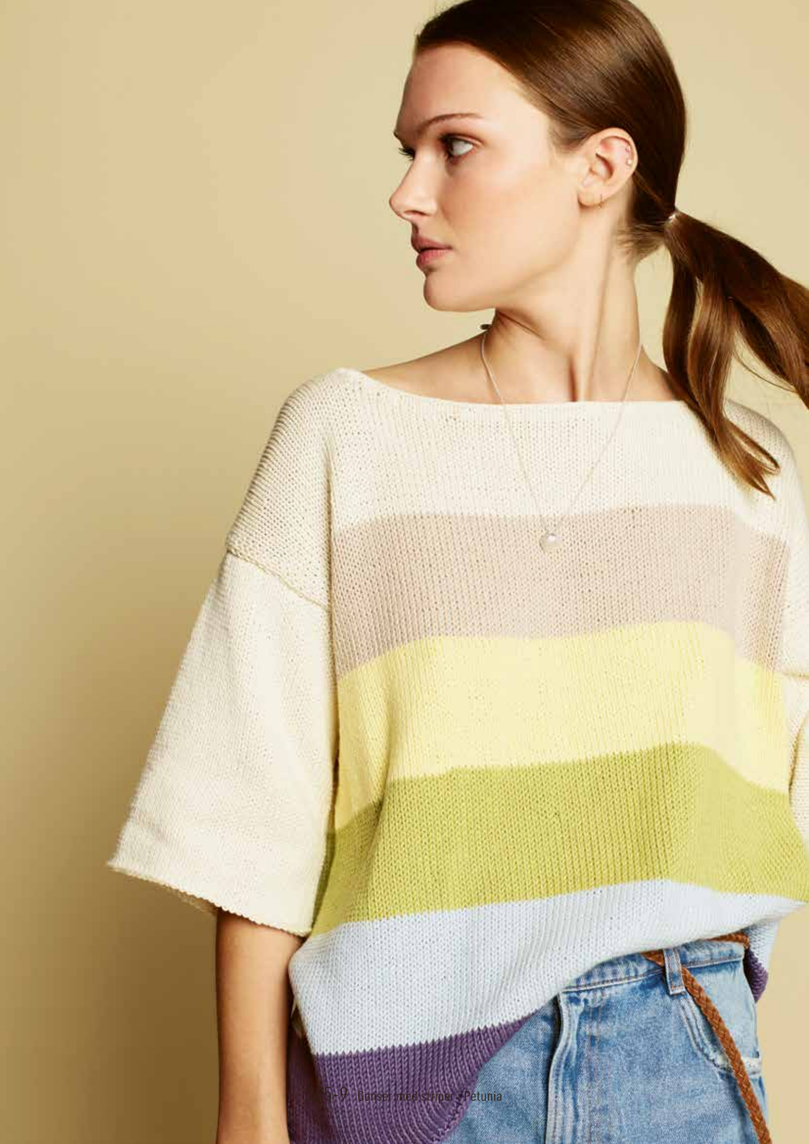
205-9 Genser med striper i Petunia