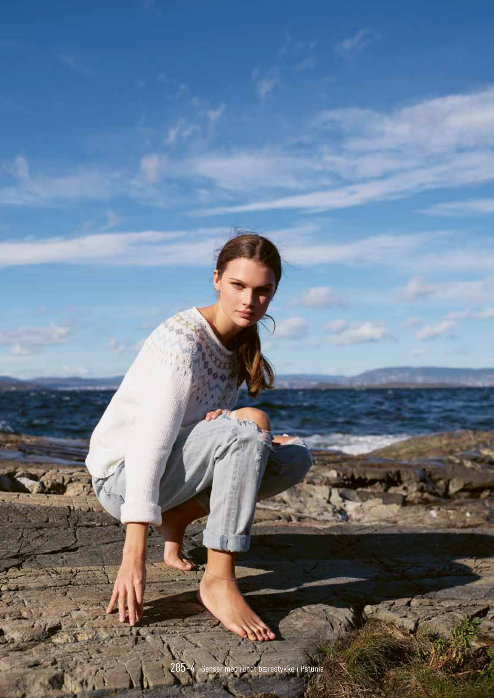
285-4 Genser med rundt bærestykke i Petunia