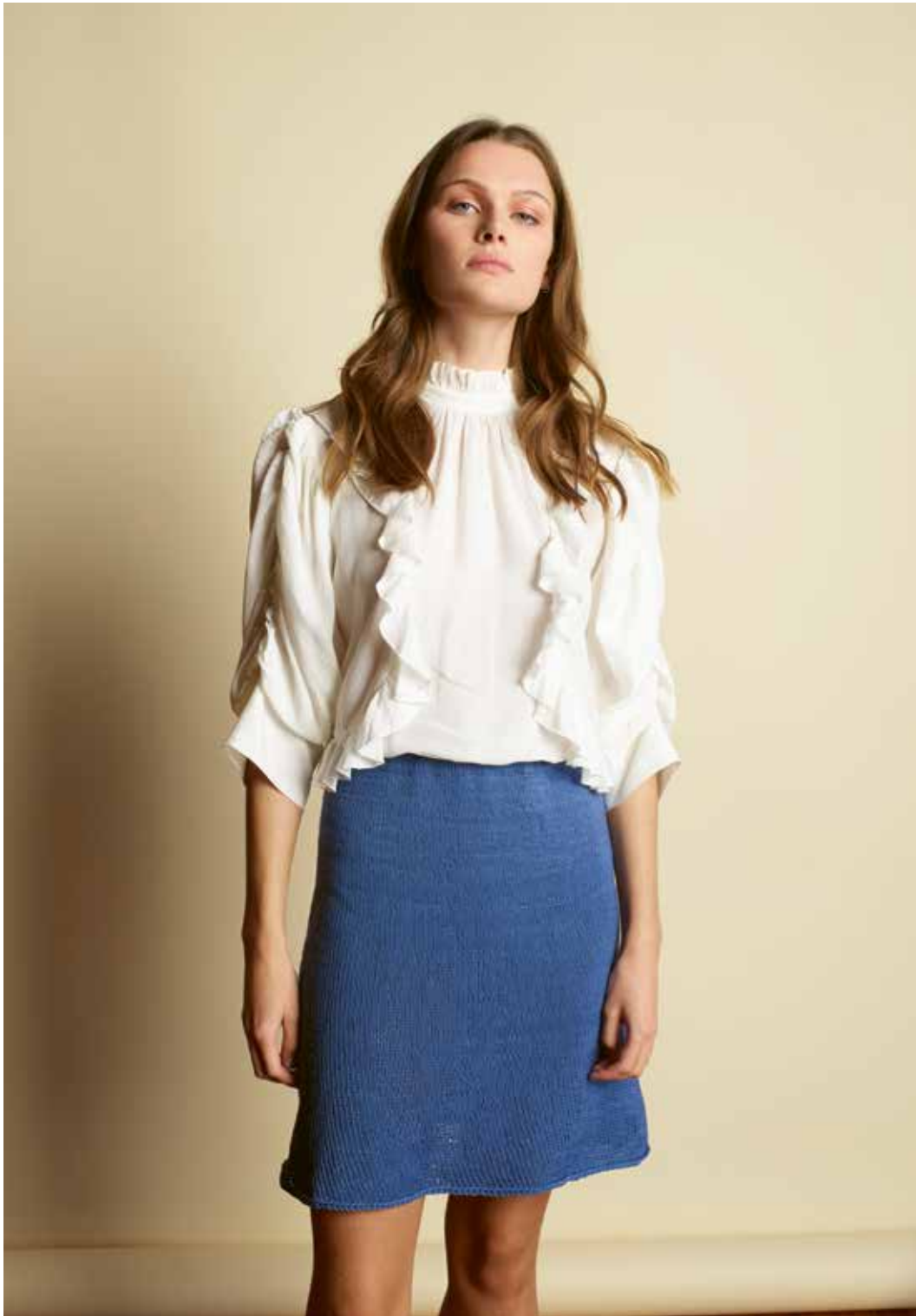
285-5 B Kort skjørt i Pandora