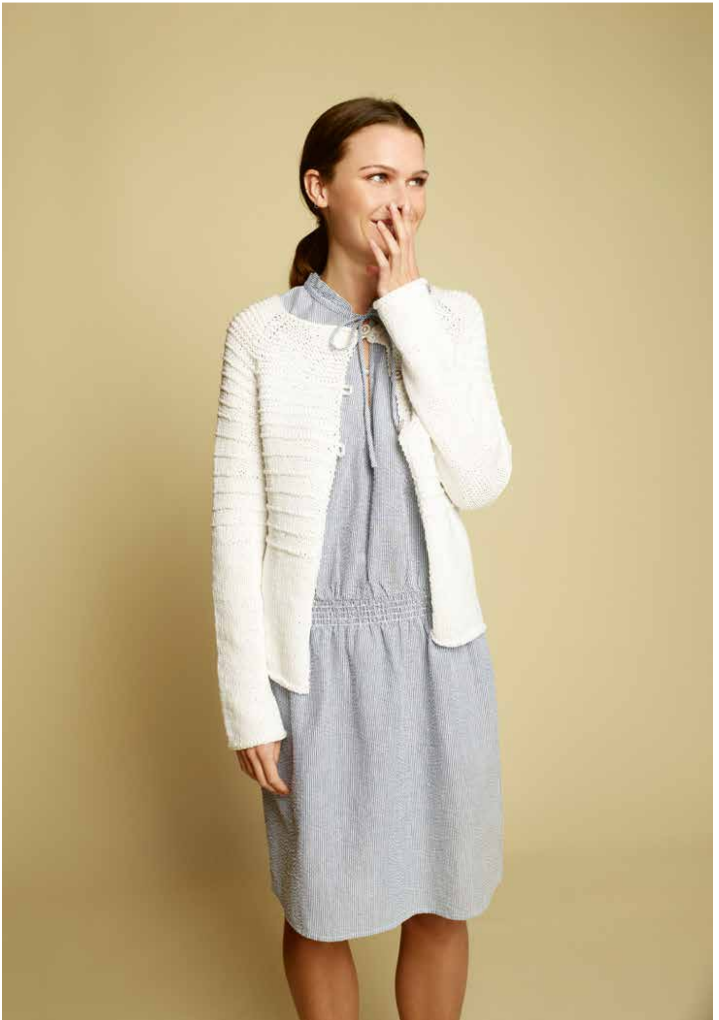
285-10 Jakke med raglanfelling i Sumatra