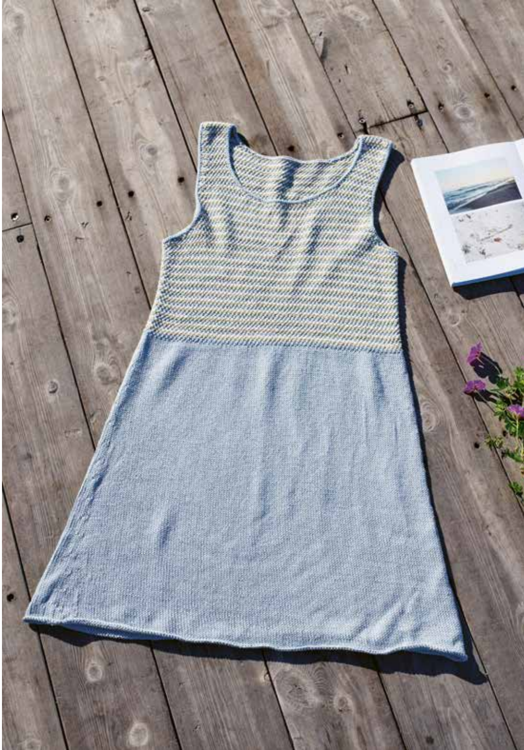
285-11 B Kort kjole i Pandora