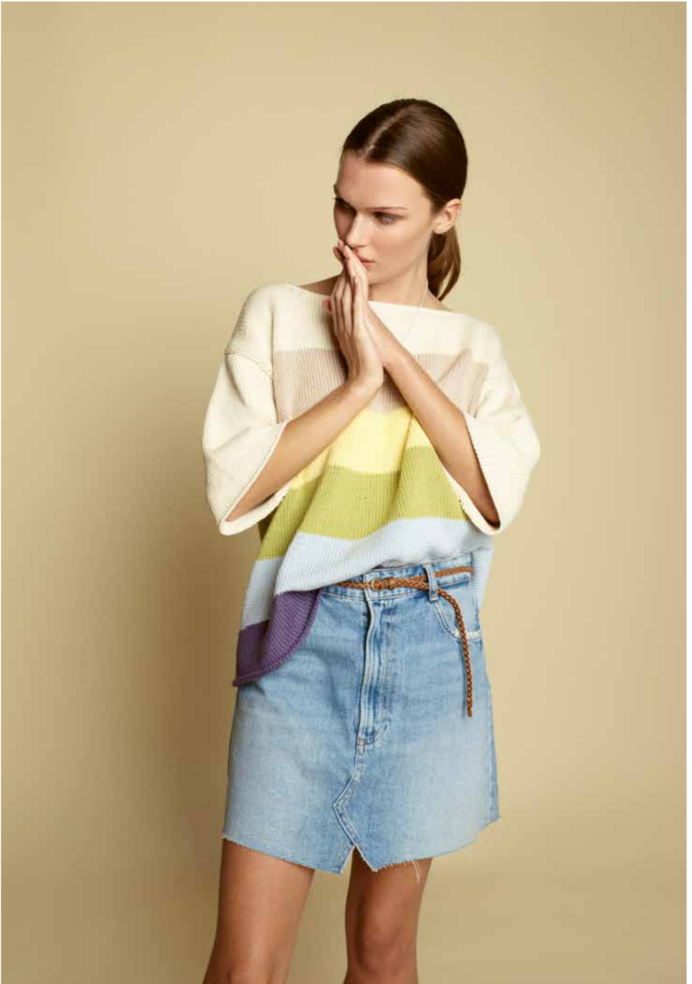
285-9 Genser med striper i Petunia