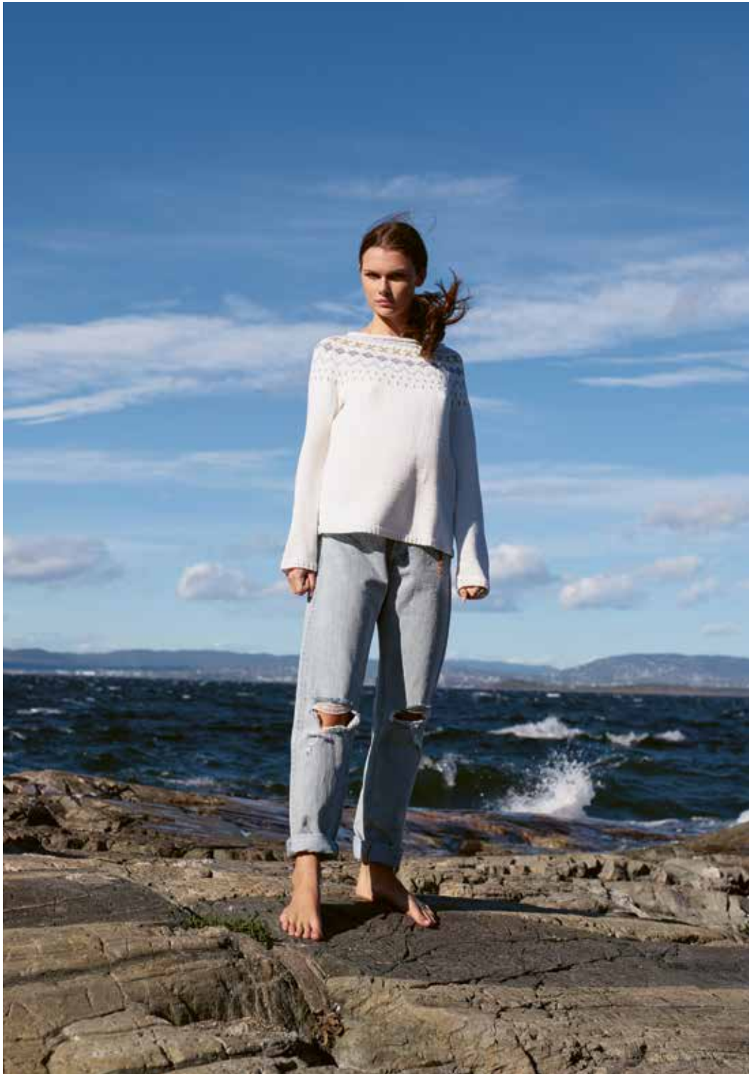
285-4 Genser med rundt bærestykke i Petunia