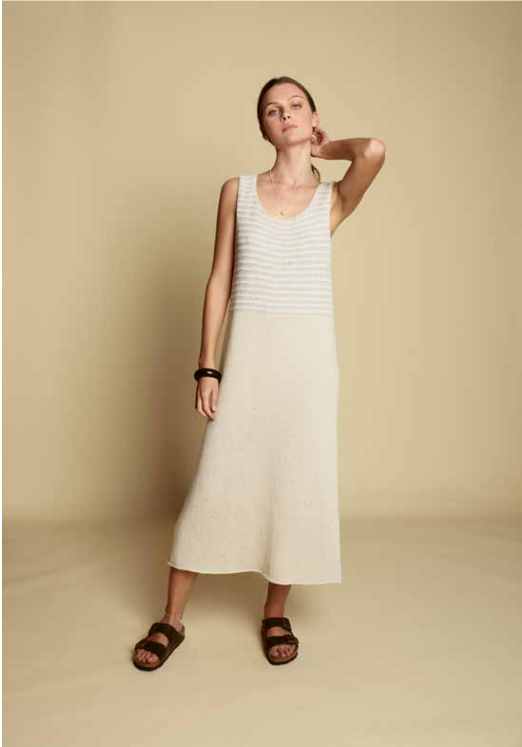
285-11 A Lang kjole i Pandora