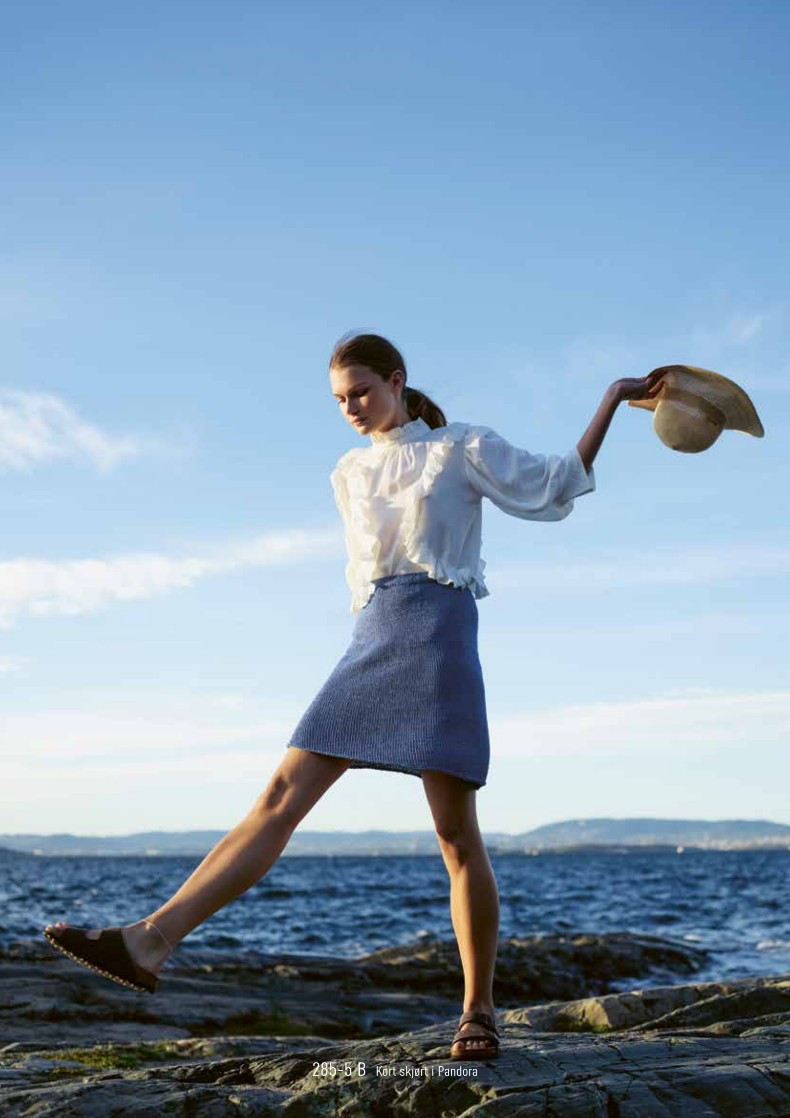
285-5 B Kort skjørt i Pandora