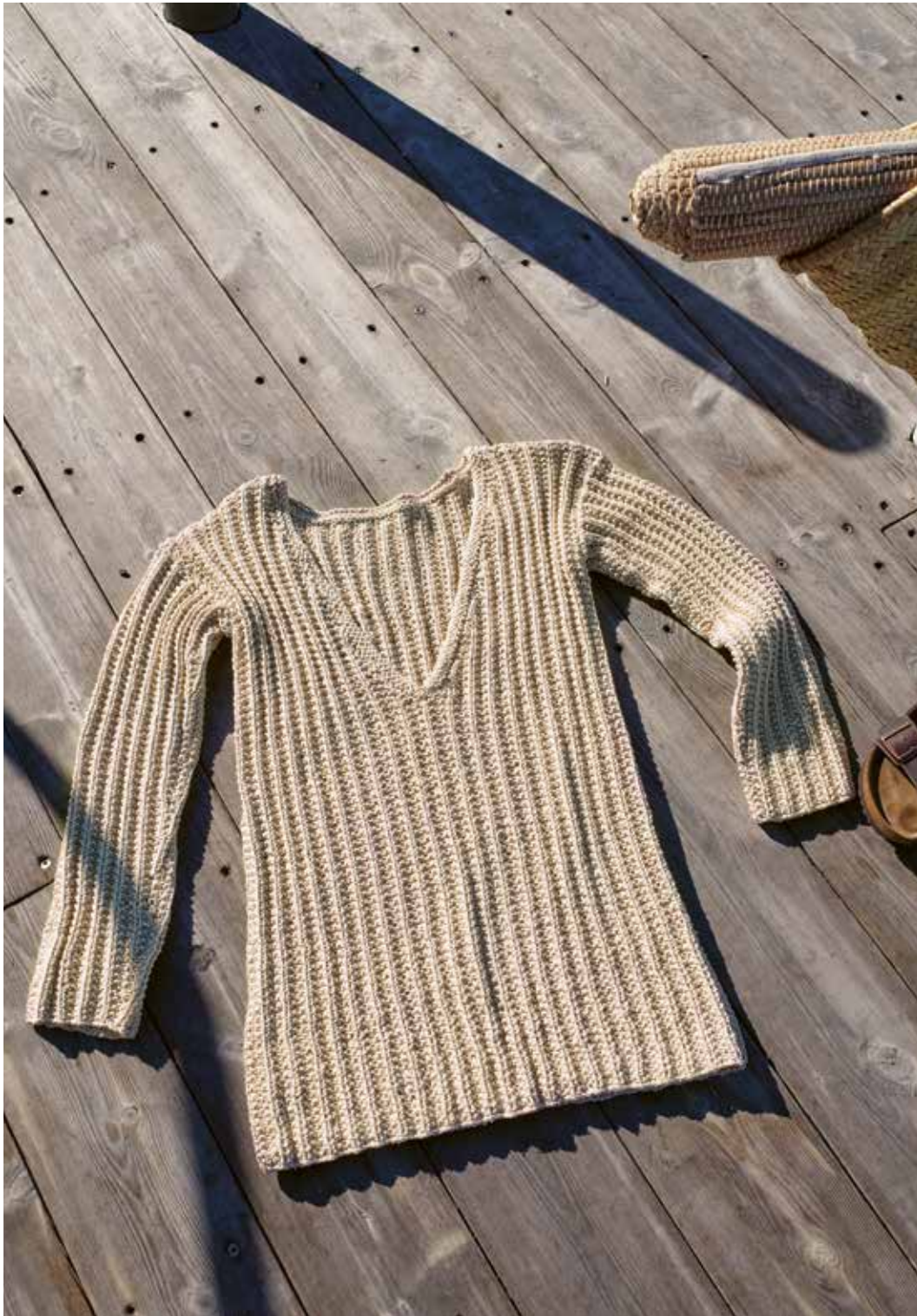
285-7 Genser med V-hals i Sumatra