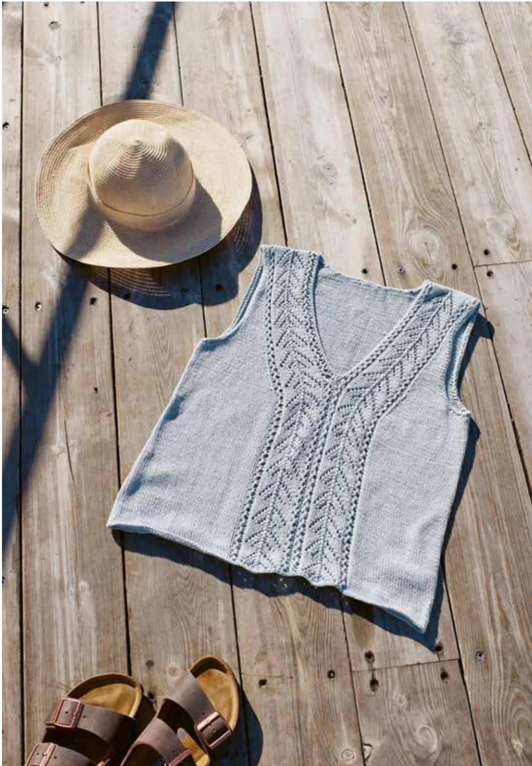
285-6 Topp med hullmønster i Pandora