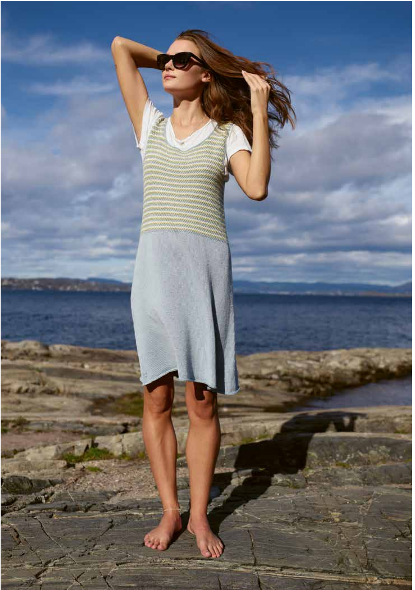
285-11 B Kort kjole i Pandora