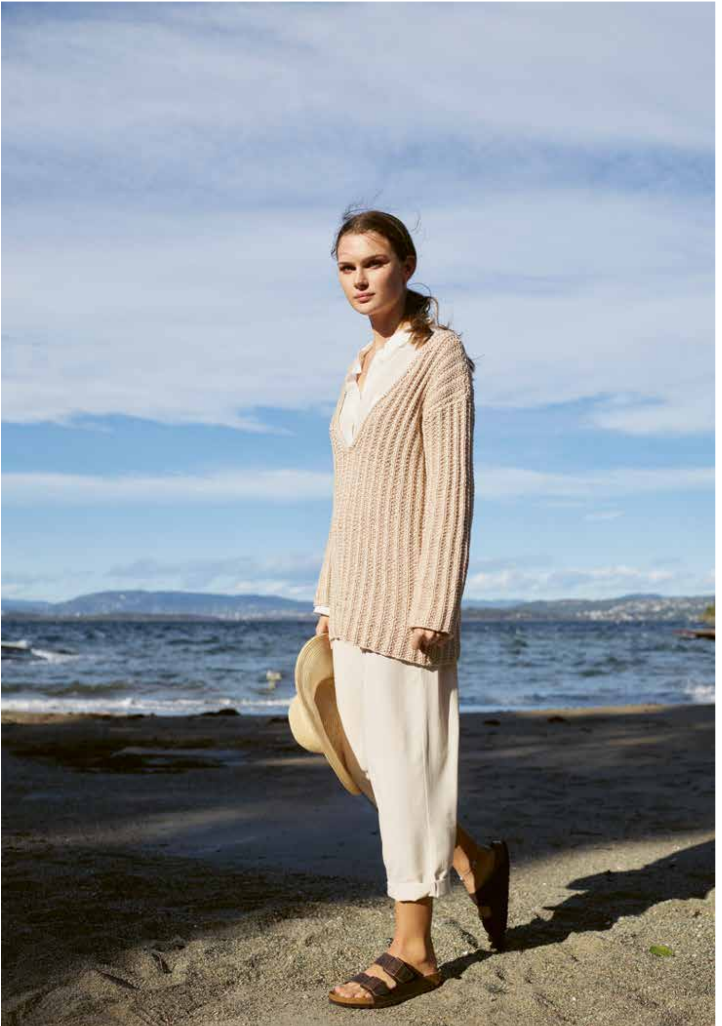
285-7 Genser med V-hals i Sumatra