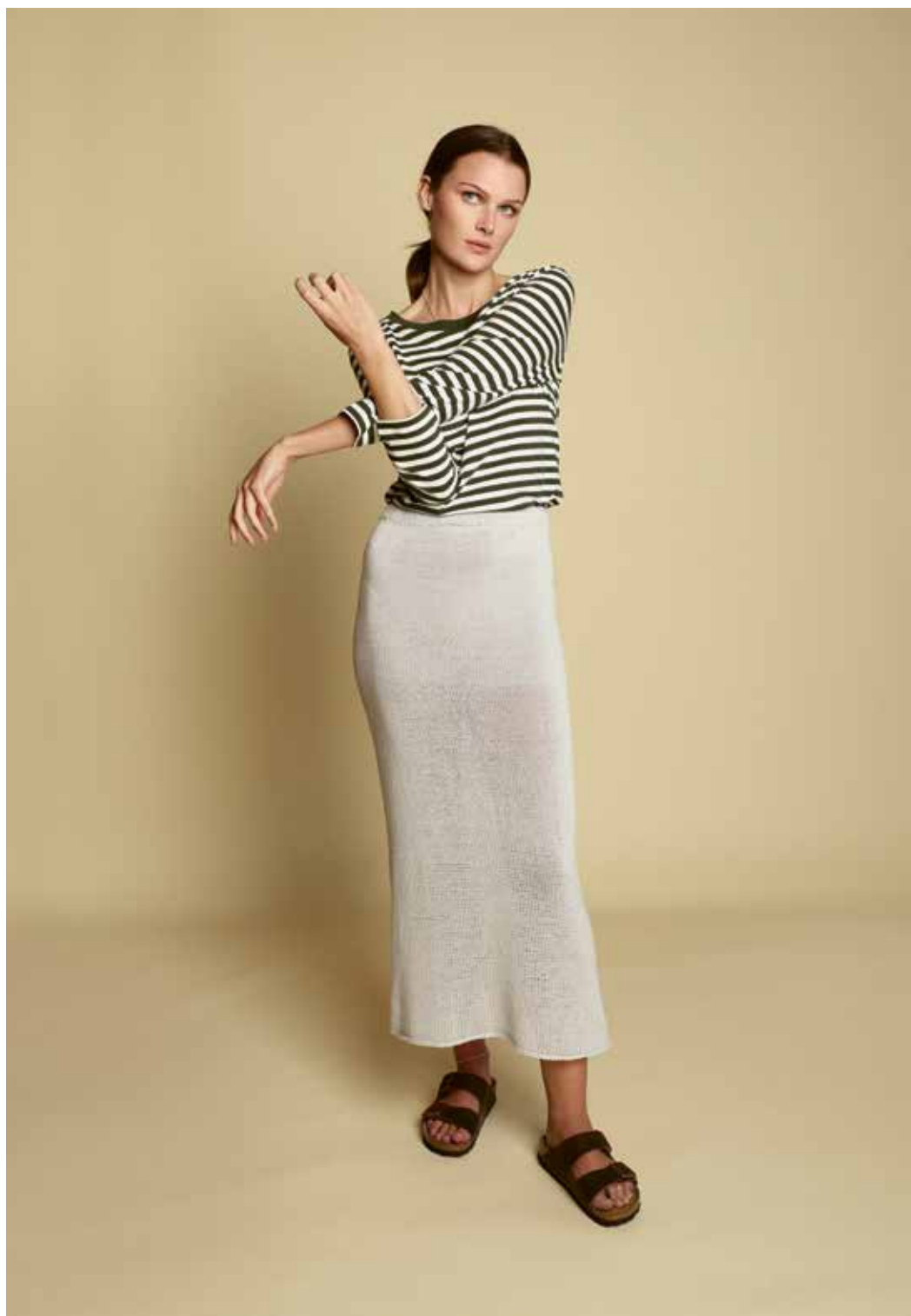
285-5 A Langt skjørt i Pandora

Se forhandlerliste på www.raumagarn.no Del arbeidet ditt på Instagram #raumagarn