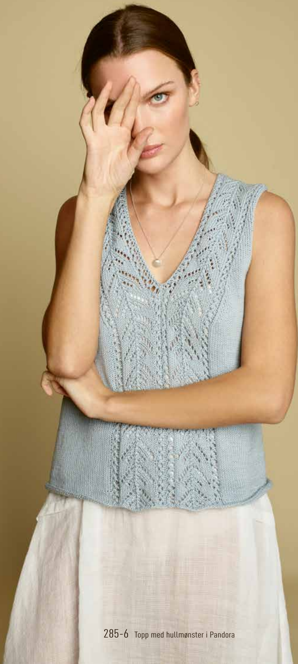
285-6 Topp med hullmønster i Pandora